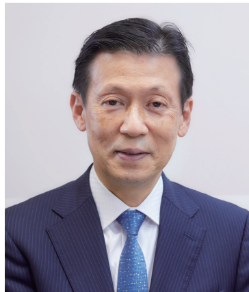
慶應義塾大学医学部 整形外科 教授

運動器とは身体活動を担う筋・骨格・神経系の総称であり、身体運動に関わる様々な組織・器官によって構成されており、人が自分の意志で活用できる唯一の臓器です。立つ、歩く、走る、ものを運ぶなどの運動器を使った身体活動により、人として自律した生活が行えます。運動器に支障を生じるとこれらの活動が困難になり、生活の質（QOL）が大きく損なわれます。