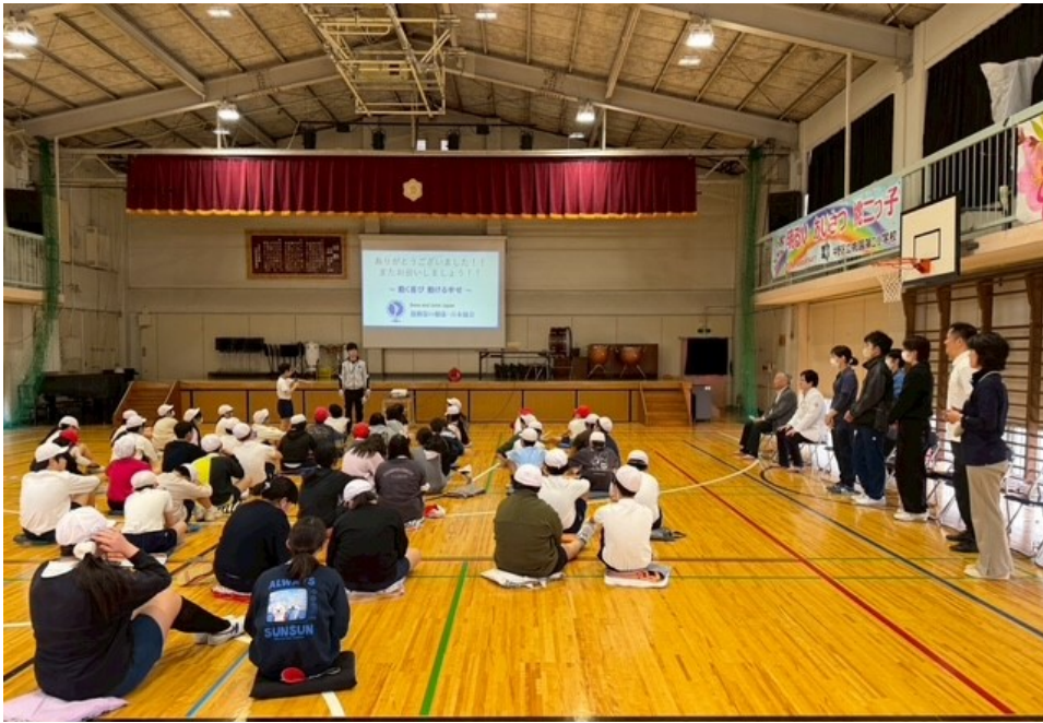
<桃園第二小学校 6年生児童の皆さんからの言葉に胸を打たれる講師陣>